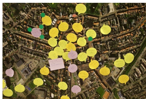
Foto: Op een luchtfoto van Oostburg werden tal van tips gedeeld